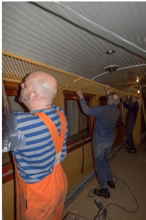
Motorvagn 33 under renovering.

Vi bjuder på kaffe och kaka. Vägbeskrivning hittar du på www.roslagsbanan.com/maskin/hitta.shtml